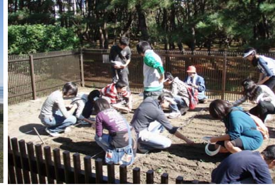
<中学校との協働作業>