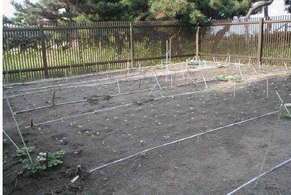
<辻堂海浜公園内の圃場>